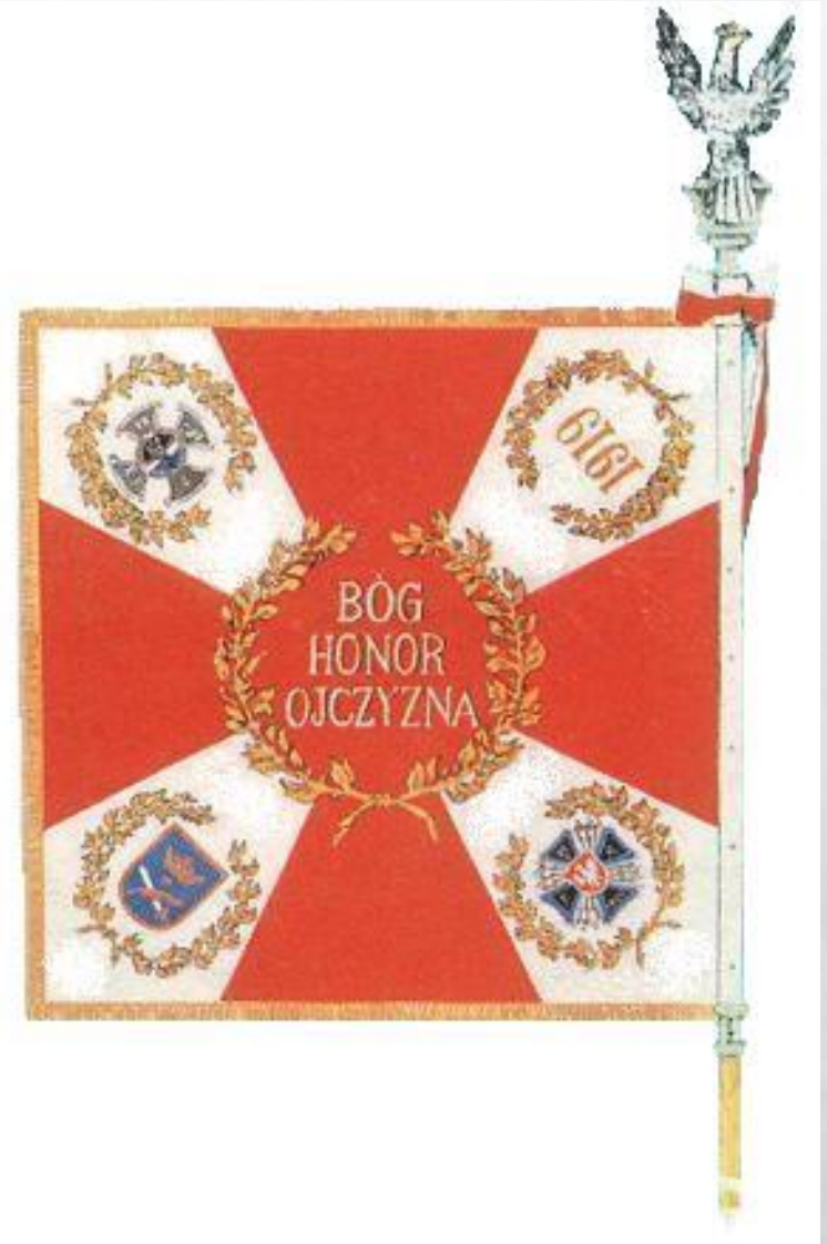
Sztandar 2 Brygady Łączności